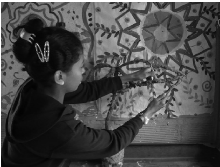
Fotografía: Empoderarte. Medellín, Colombia.