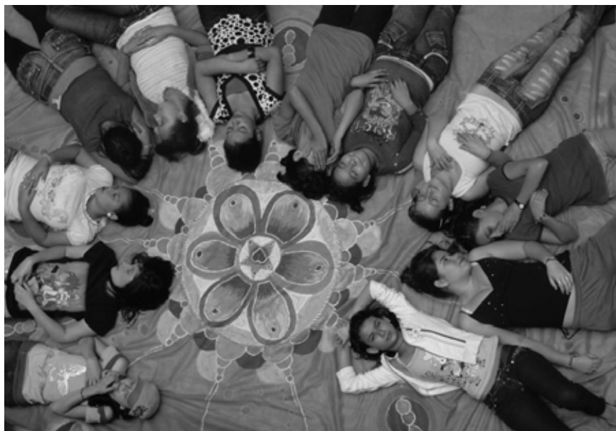
Fotografía: Empoderarte. Medellín, Colombia.

pertenecer a sus bandos, o a ganar un dinero “fácil” prostituyéndose, robando o matando. Un joven traduce las situaciones de violencia con estas palabras: