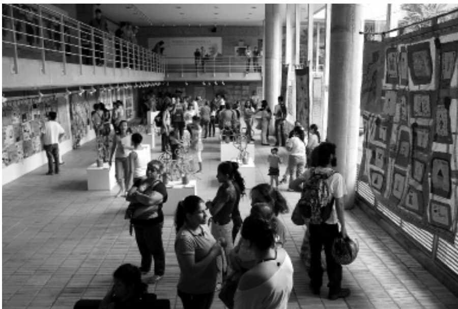
Fotografía: Empoderarte. Medellín, Colombia..

metodología propuesta y el proceso, es decir, lo que esa metodología posibilitó a los y las participantes.