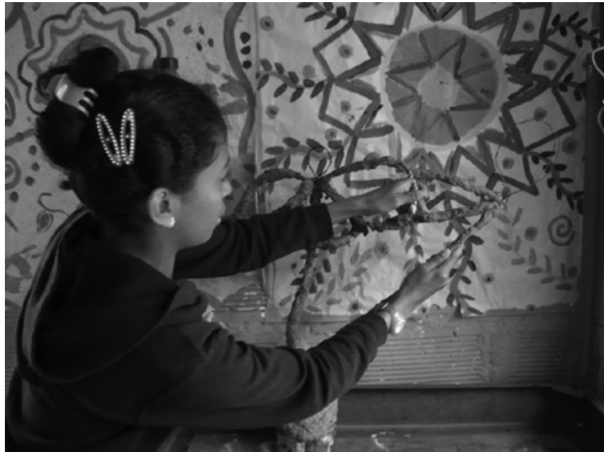
Medellín, Colombia.