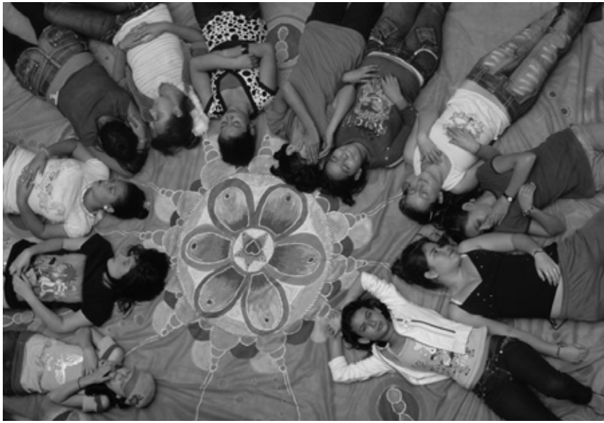
Fotografía: Empoderarte. Medellín, Colombia.

pertenecer a sus bandos, o a ganar un dinero “fácil” prostituyéndose, robando o matando. Un joven traduce las situaciones de violencia con estas palabras: