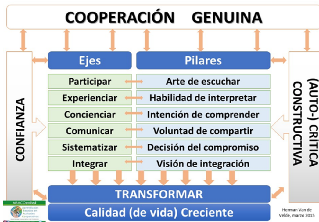
Imagen No.4. Pilares y ejes de la Cooperación Genuina

La Cooperación genuina está sustentada en seis pilares : arte de escucha, habilidad de interpretación, intención de comprensión, voluntad de compartir, decisión de compromiso y visión de integración ; dos ambientes o catalizadores : confianza, crítica y autocrítica constructiva; concretándose en y desde seis ejes principales: participación, experienciación, concienciación, sistematización, comunicación e integración (ver imagen No. 4). Estos pilares y ejes son componentes esenciales de todo procesos de 'transformación' orientada a calidad (de vida) creciente desde los enfoque de BuenVivir, VivirBien y BienSER al que ya nos referimos antes.